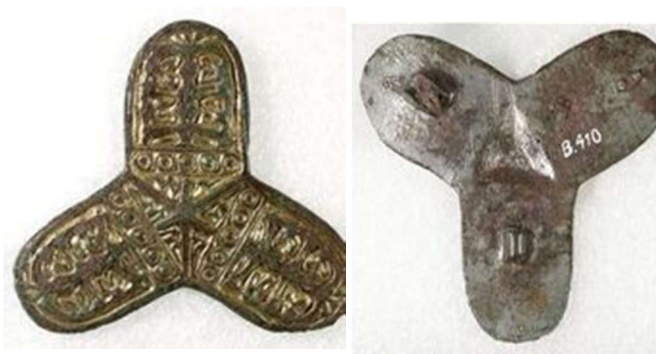
Fig. 4. For- og bagside af trefliget spændet fra 1932. Bemærk den forgyldte forside med den stiliserede planteornamentik og fortinningen med filespor på bagsiden

– samt fastgørelsesanordning til den nu manglende nål.