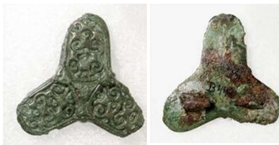
Fig. 5. Det trefligede spænde fra 1934 har muligvis også haft forgyldning på forsiden – og i hvert fald fortinning på bagsiden. Foto: Jørgen Nielsen.

– samt fastgørelsesanordning til den nu manglende nål. Foto: Jørgen Nielsen.