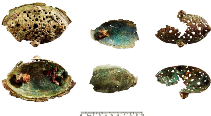
Fig. 2. For- og bagside af de to skålformede spænder, der blev reddet fra auktionen. Bemærk detaljerne i ornamentikken.

Spænderne er udsmykket med dyrefigurer, som var et yndet motiv i vikingetiden, og de små huller, der er i metallet, afslører, at der oprindeligt har siddet pyntesøm med fortinnede eller måske forgyldte hoveder. Ud over at have en praktisk funktion har spænderne også haft en symbolsk betydning. De har dels afspejlet bærerens sociale position som den frie bondes hustru – og jo finere kvalitet smykket havde – jo mægtigere var bonden. Dernæst har smykkets mønstre ikke efterladt beskuerne i tvivl om, at hun tilbad de hedenske guder med Odin i spidsen! Nøglen, der kan have hængt under spænderne, kan endvidere have symboliseret, hvem der bestemte over husstandens værdier – ikke mindst når husbond var fraværende i forbindelse med togter.