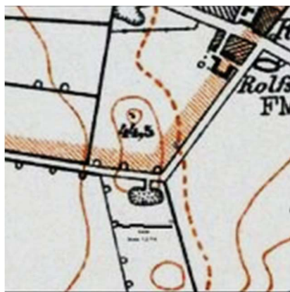
Fig. 1. På målebordsbladet fra starten af 1900-tallet ses den endnu ikke særligt udstrakte grusgrav umiddelbart syd for Rolighedsvej. Det røde, skraverede bælte langs vejen er skellet mellem Rolsted sogn i syd og Davinde sogn i nord. Omkring højdepunktet 44,5 ligger tomten af to rundhøje fra sten- eller bronzealder.