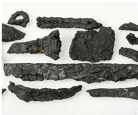
Fig. 6. Et udvalg af de forrustede jerngenstande, bl.a. øskener til fastgørelse af hanken i en stavbygget spand.