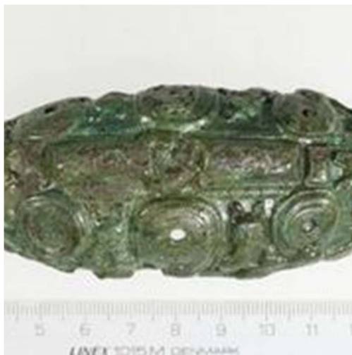
Fig. 3. Forsiden af spændet fra 1934. Bemærk ansigtsmaskerne og huller fra nu udfaldne, fortinnede bronzenitter.

De to kløverbladsformede spænder, der kom til museet i Odense i 1932 og 1934, tilhører en smykketype, der har været båret enkeltvis. Fra mange gravfund ved vi, at de har siddet centralt foran på brystet, hvor de har samlet en kappe eller et slag, der har været båret over den egentlige dragt. Det har således været dette smykke, man så før noget andet. Begge smykker er lavet af bronze, men forsiden har været dækket af et tyndt lag guld og bagsiden af et tykt lag tin. For dem, der så smykket, skulle det altså se ud som om det var lavet af forgyldt sølv – fint skulle det være!